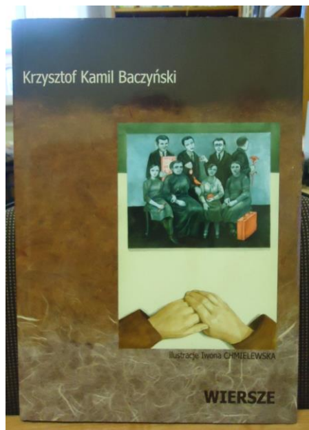
Krzysztof Kamil Baczyński, Wiersze.